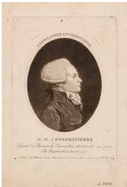
Législateur incorruptible/M.M.J. Robespierre./Député du Département de Paris à la Convention Nationale en 1792. Musée Carnavalet - Histoire de Paris G.39242.