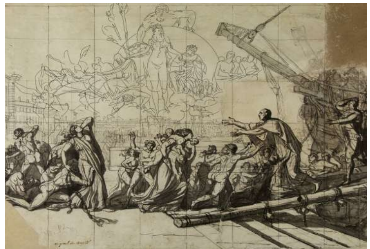
ill. 35 Jacques Louis David, Le Serment du Jeu de Paume, le 20 juin 1789 , 1791, dessin à la plume et au pinceau, aux encres bistre et noire, rehauts de blanc, 66 × 101,2 cm, Versailles, château de Versailles, inv. DES5736